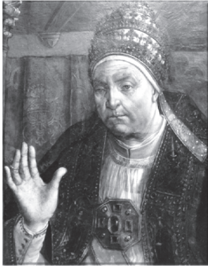
Papa IV. Sixtus

Cenova komiseri Zaharya, Galata'nın Cenova ayağını acil bir şekilde topladı. Galata Kulesi'nin ve Kale'nin anahtarlarını Fatih Sultan Mehmet'e teslim ettiler. Bu şekilde mevcut hukuk ve ticari imtiyazlarının devam etmesini ve uzatılmasını talep ettiler. Bunun üzerine padişah vekili Zağanos Paşa, mahiyetindeki askerlerle birlikte Galata Kalesi'ne girmiş ve Galata ahalisi tarafından büyük bir merasimle karşılanmıştı. İmtiyazlar Fatih Sultan Mehmet tarafından gönderilen bir ahidname ile korunmuş, Galatalılara yeni kilise inşa edilmeden ve kilise çanı çalınmadan mevcut dini vecibelerini yaşayabilecekleri belirtilmişti. Ayrıca bu haklar karşılığında Osmanlı İmparatorluğu'na vergi ödeyeceklerdi. Angelo Zaharya, durumu gizlice gönderdiği mektupla dönemin papası IV. Sixtus'a anlatmıştı. Osmanlı'daki, içlerinde Zaharya'nın torunu Empiyolis'in de bulunduğu esirlerin kurtarılmasını istiyor, fakat elinden hiçbir şey gelmiyordu.