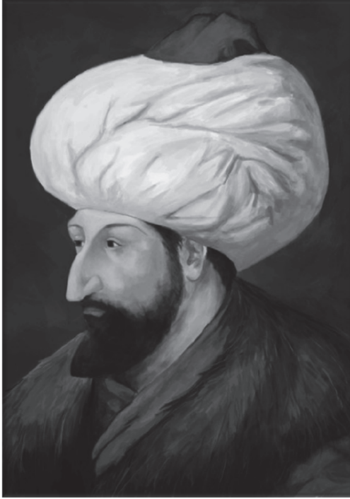
Fatih Sultan Mehmet

İstanbul, 29 Mayıs 1453 günü II. Mehmet önderliğinde Osmanlılar'ın istilasına uğramıştı. Galata ahalisi bu muhasaranın uzayacağını ümit ediyordu. Osmanlı Ordusu'nun İstanbul'a girmesiyle Bizans kaçaklarının kalelerin önüne kadar gelmesi Galata ahalisini dehşete düşmüştü. O sıralar Galata komiseri olan Angelo Zaharya'nın torunu Empiyolis'in de içinde bulunduğu bir grup Galatalı Bizans'a yardıma gitmişti. Fakat iş işten geçmişti. Bu grubun bazıları ölmüş, içinde Empiyolis'in de bulunduğu bir kısım Galatalı ise esir düşmüştü. Fatih Sultan Mehmet bu duruma içerleyip Galatalıların yani Cenovalıların hak ve hukukunu tanımayacağını söylemişti. Bu söylem Galata'da korku yaratmıştı.