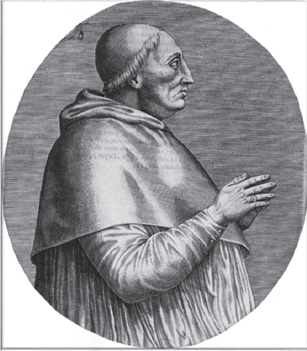
Papa VIII. Innocentius

VIII. Innocentius hırslı bir adamdı. Fransa ile bir anlaşma yaptı ve Cem Sultan'ı Roma'ya getirtti. Cem Sultan, Marsilya yolu ile Roma'ya getirilerek Papa VIII. Innocentius ile görüştürüldü. Papa Cem Sultan'a Osmanlılar'a karşı bir haçlı seferi düzenlemeyi teklif etti. Bu yeni Haçlı Seferi'nde fethedilen tüm toprakların yeni İmparatoru Cem Sultan olacaktı. Cem Sultan bu teklifi kesinlikle reddetti. Osmanlı İmparatorluğu'na, milletine karşı Hristiyanlarla omuz omuza savaşmak onun vicdanına sığmazdı. Başta Macaristan Kralı olmak üzere Memlûklü Sultanı ve diğerlerinin Cem Sultan'ı istemesi Papa'yı zora sokuyordu. Bu süre içerisinde hem Papa'ya hem de Cem Sultan'a defalarca suikast girişiminde bulunulmuştu.