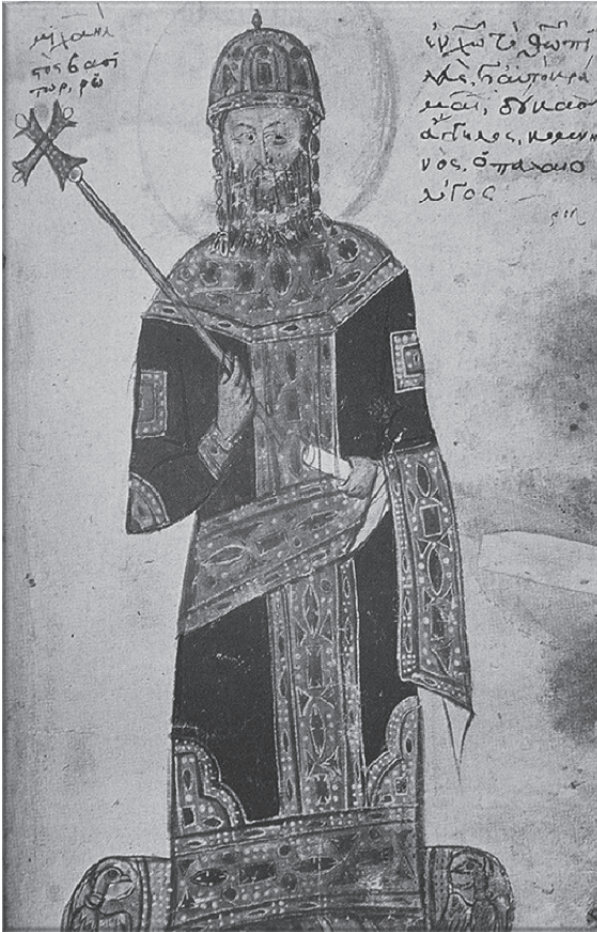
VIII. Michael Palaiologos

Michael Palaiologos Ceneviz Cumhuriyeti'nin yardımı ile İstanbul İmparatorluğu'nun yeni İmparatoru seçilmişti. Bu vesileyle 1 Ocak 1259'da seçilir seçilmez Galata bölgesinin harici ticareti Cenevizlilerin eline geçmişti. 1259'dan 1453'e kadar Galata halkı bağımsız yaşadı.